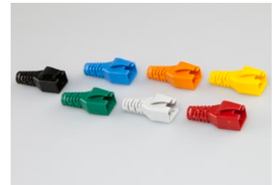
Alternativ auch mit Flex-Tülle lieferbar